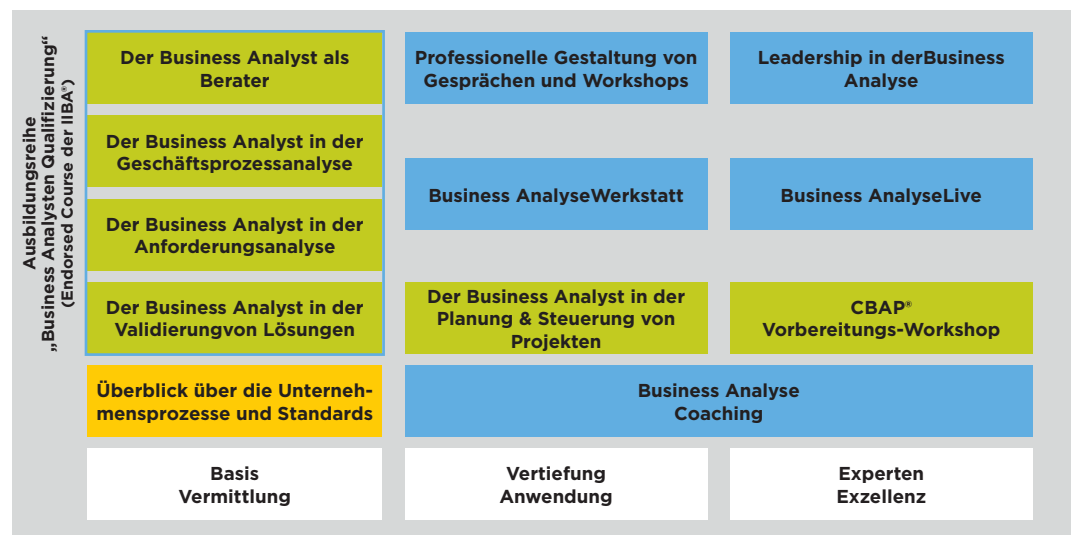
Qualifizierungsarchitektur Business Analyst

Die CSC Deutschland Akademie ist anerkannter Trainingspartner (Endorsed Education Provider) des International Institute of Business Analysis IIBA . Den vier Bausteinen der „Business Analysten Qualifizierung“ wurde mit der Anerkennung als „Endorsed Course“ bescheinigt, dass sie den weltweit anerkannten Standards des Business Analysis Body Of Knowledge® entspricht.